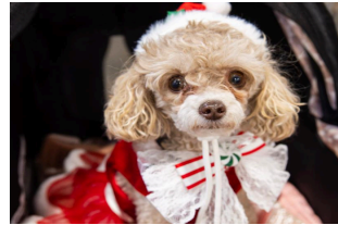
Exposición Canadiense de Mascotas de Navidad 2025 en Mississauga, Canadá