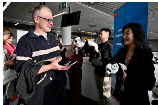
Hainan Airlines de China inaugura nuevo vuelo directo entre Bruselas y Chongqing