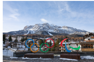
Paisaje invernal de Cortina D'Ampezzo, Italia