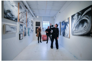
Eastside Culture Crawl en Vancouver, Canadá