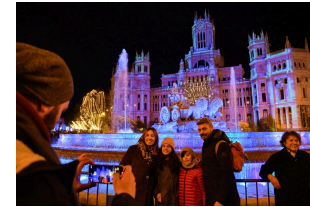
Madrid celebra ceremonia de encendido navideño