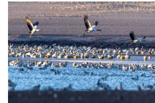
Aves migratorias en Lhunzhub de Lhasa en Xizang