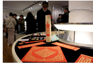
Exposición "Hanzi de Occidente, Letras de Oriente" en Londres, Reino Unido