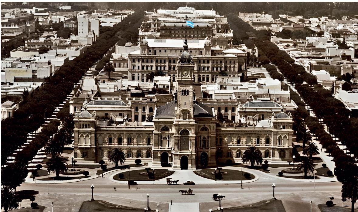
Palacio Municipal, Avenidas 51 y 53 y Eje Cívico de La Plata vistos desde la Catedral en 1932.

La ciudad contemporánea, sin embargo, no se agota en el plano fundacional. Debido a procesos de crecimiento suburbano, la mancha urbana se expandió más allá del “cuadrado” planificado, donde actualmente reside un tercio de la población total de la ciudad. Además del crecimiento en altura del casco fundacional, se identifican tres ejes de crecimiento suburbano (norte, sudeste y sudoeste) con características distintivas desde el punto de vista social, urbano y ambiental. De esta manera se observa un fuerte contraste entre un área central socioeconómicamente homogénea, predominantemente habitada por la clase media y dotada de infraestructura, servicios y bienes urbanos, y una periferia heterogénea en términos sociales, económicos y espaciales, donde conviven áreas residenciales de clases medias y altas con grandes áreas de pobreza y zonas periurbanas destinadas a la producción florihortícola, la cual constituye un nodo clave en la producción de alimentos para la Región Metropolitana de Buenos Aires y se ve actualmente presionada por la expansión de barrios cerrados de clases altas y asentamientos informales populares.