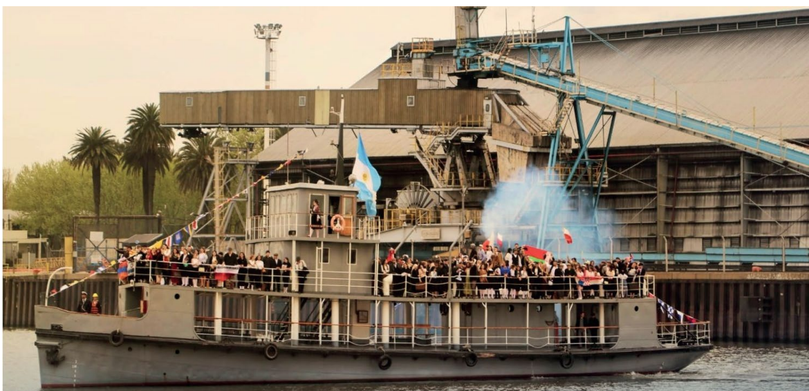
Recreación simbólica del Desembarco de Inmigrantes en Berisso

El cierre definitivo de fábricas emblemáticas, particularmente Swift y Armour, en la década del ochenta marcó el declive industrial en Berisso, provocando un fuerte impacto social y económico. Actualmente la ciudad de Berisso cuenta con una población de 101.263 habitantes, con un perfil orientado a actividades industriales residuales, producción agropecuaria hortícola, comercios, servicios.