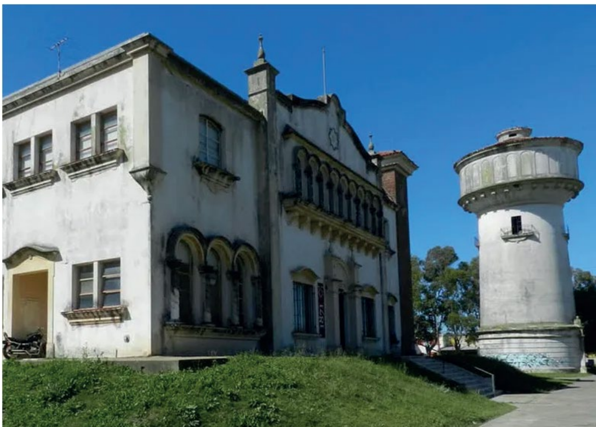
Fachada del museo 1871 y toma de agua